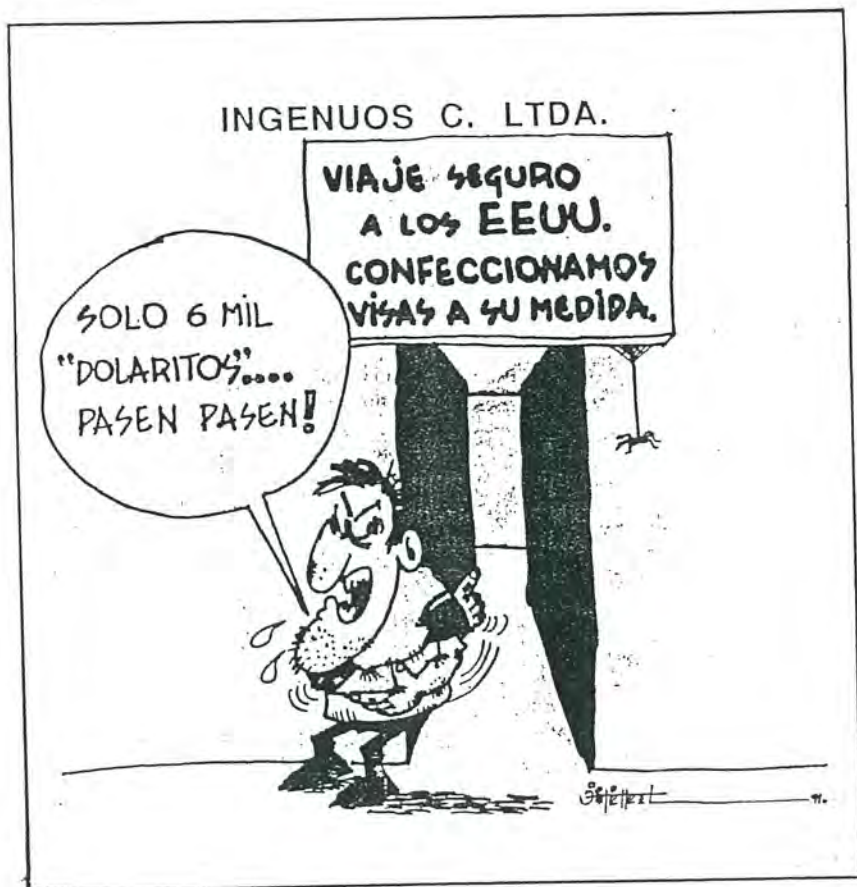
Tomado de Diario El Mercurio de Cuenca del 12 de Junio de 1991

Las irregularidades suscitadas en torno al tráfico de ilegales se ven alimentadas por la propia clientela de migrantes potenciales que aceptan los términos informales de transacción que imponen los tramitadores. Según nuestros informantes todos los ilegales tienen visados y pasaportes falsos y con otros nombres y, pese a saber que no son documentos auténticos, pagan lo que se les pide.